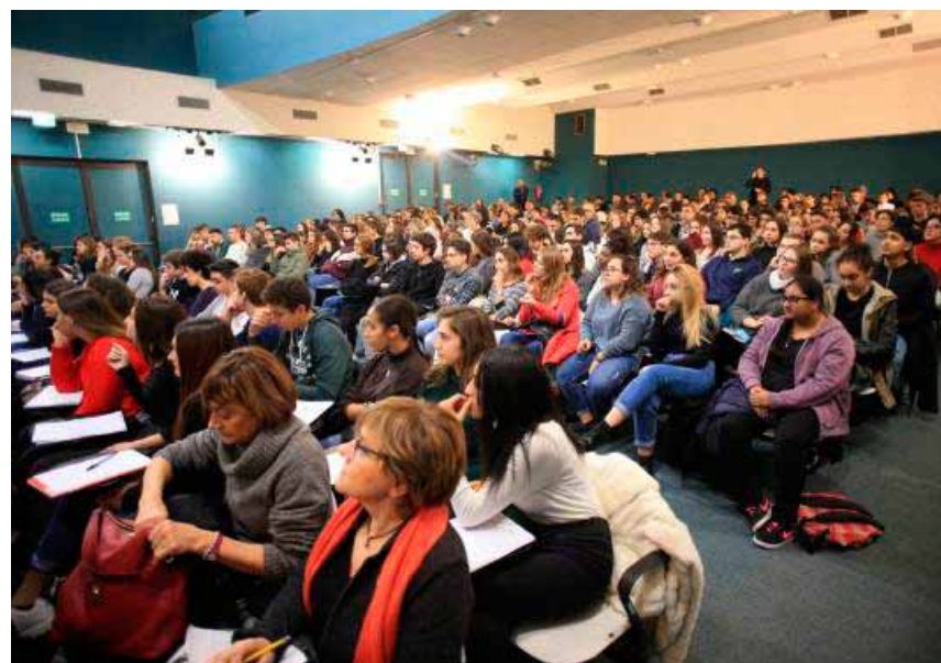
Gli studenti che hanno assistito all'incontro

TUTTI GLI ESSERI UMANI NASCONO LIBERI ED UGUALI IN DIGNITÀ E DIRITTI